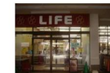
⑪ スーパー 徒歩1分