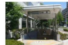
⑥ 長堀鶴見緑地線 西大橋駅 徒歩4分