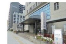
⑨ 西区役所 徒歩8分