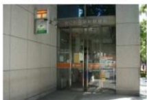
③ 郵便局 徒歩3分