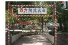
⑦ 公園 徒歩3分