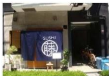
① 寿司屋 マンション1F

駅から近く、アクセス抜群！！ コンビニやスーパーもすぐそばにあり 生活しやすいですよ★