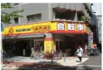
⑤ 自転車屋 徒歩4分