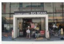
④ スーパー 徒歩4分