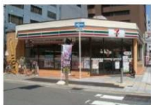
② コンビニ 徒歩2分