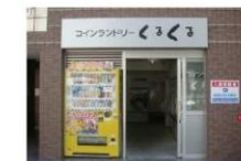
⑩ コインランドリー 徒歩1分