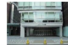
⑧ オリックス劇場 徒歩5