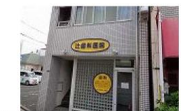
⑪ 歯医者 徒歩3分