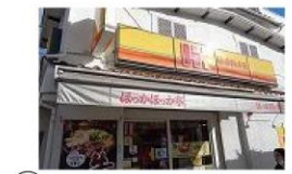
⑦ 弁当屋 徒歩1分