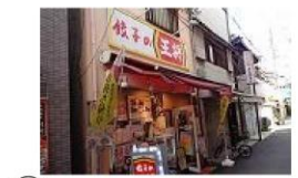
⑥ 飲食店 徒歩1分