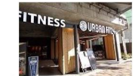
③ フィットネス 徒歩1分