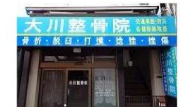
⑧ 整骨院 徒歩1分