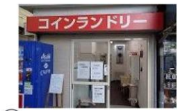
⑩ コインランドリー 徒歩2分