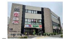
⑫ 眼科・内科・薬局 徒歩4分