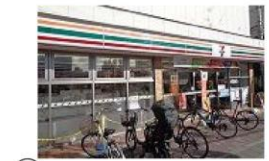
⑤ コンビニ 徒歩1分