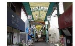
⑨ 南しぎの商店街 徒歩2分