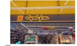
④ ドラッグストア 徒歩1分