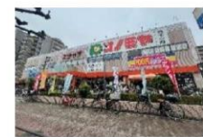
② コノミヤ鳴野西店 徒歩8分