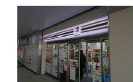
⑬ コンビニ 徒歩1分