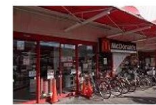
① コノミヤ鳴野店 徒歩1分

駅から近く、アクセス抜群！！ コンビニ・スーパー・飲食店 何でもそろってとても便利です★